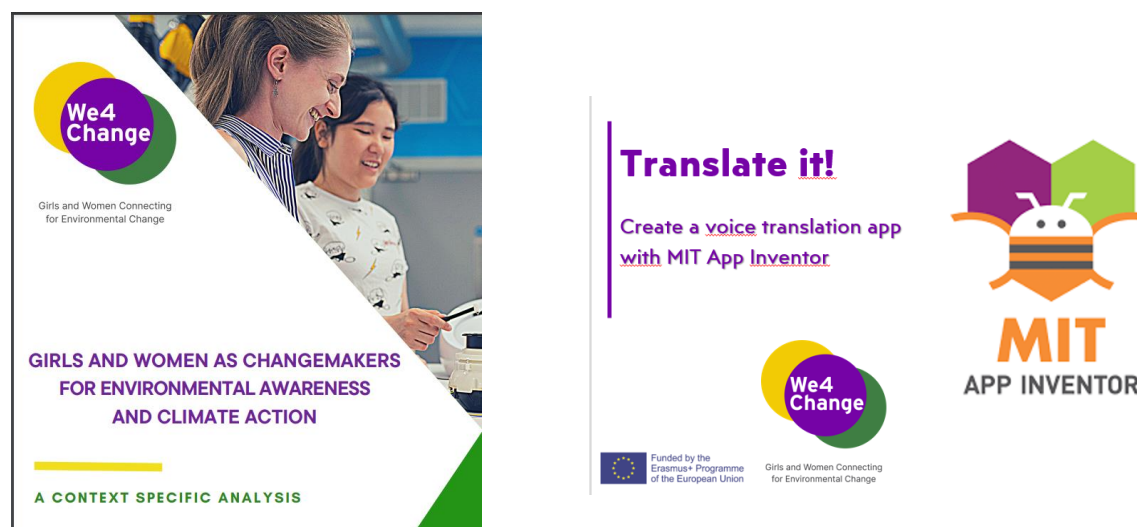
Prezentarea materialelor educaționale We4Change

We4Change a adoptat cercurile și culorile verde, violet și galben ca și culori ale identității sale vizuale. Aceste elemente se regăsesc întotdeauna pe materialele educaționale elaborate și pe postările din social media: