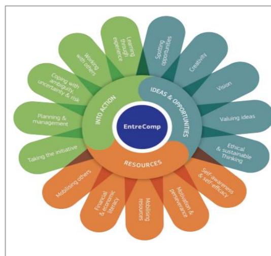
Figura: Cadrul EntreComp