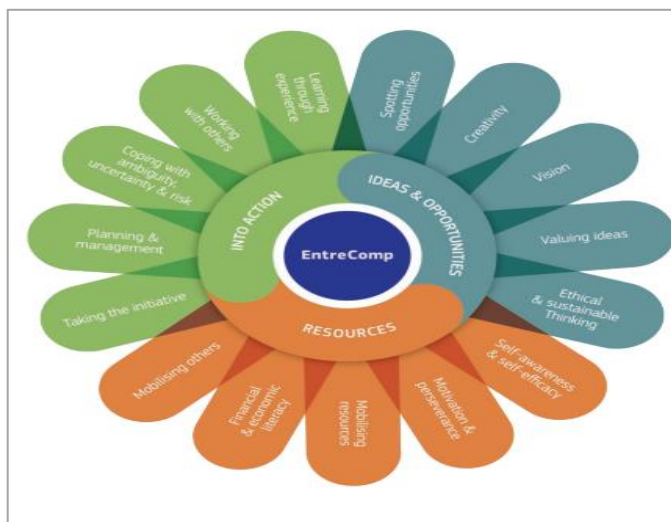
Σχήμα: Το Ευρωπαϊκό πλαίσιο επιχειρηματικών ικανοτήτων (EntreComp).

Η εφαρμογή βιώσιμων πρακτικών και η δημιουργία μιας πιο περιβαλλοντικά συνειδητοποιημένης κοινωνίας μπορεί να έχει σημαντικά οικονομικά οφέλη, από τη μείωση των αποβλήτων και τη διατήρηση των πόρων έως τη δημιουργία νέων θέσεων εργασίας και βιομηχανιών. Αναπτύσσοντας την περιβαλλοντική ευαισθητοποίηση και τη βιώσιμη σκέψη των κοριτσιών και των νεαρών γυναικών, μπορούμε να τις βοηθήσουμε να εκμεταλλευτούν αυτές τις ευκαιρίες και να συμβάλουν στην ανάπτυξη μιας πιο βιώσιμης και χωρίς αποκλεισμούς οικονομίας. Επιπλέον, η περιβαλλοντική υποβάθμιση μπορεί να έχει σοβαρές επιπτώσεις στην ανθρώπινη υγεία και ευημερία, από τη ρύπανση του αέρα και των υδάτων έως την εξάπλωση ασθενειών.