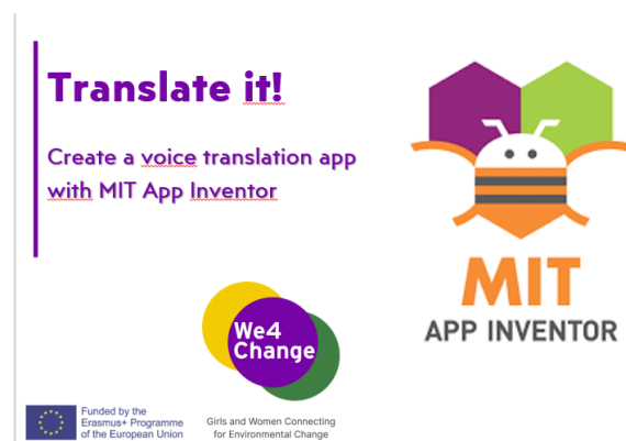
Μια παρουσίαση του We4Change